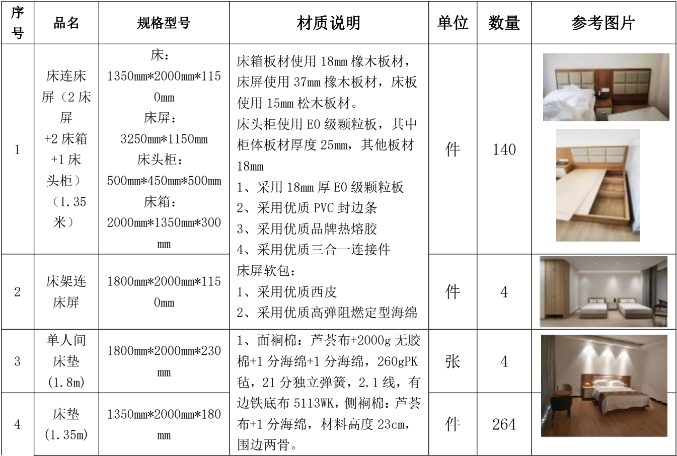
一、定制家具采购清单（表一）